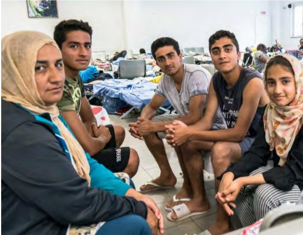
Una famiglia afghana, accolta durante il progetto di ospitalità dei profughi realizzato nel 2016 dalla Casa della Carità in collaborazione con la parrocchia e l'oratorio di Bruzzano.

Buongiorno, come ti avevamo anticipato nello scorso numero di questa newsletter, la Casa della Carità ha avviato l' ospitalità di alcuni profughi afghani , arrivati in Italia grazie ai ponti aerei delle scorse settimane. Il progetto di accoglienza è realizzato in accordo con la Prefettura di Milano e in collaborazione con Cooperativa Proges e CasAmica Onlus.